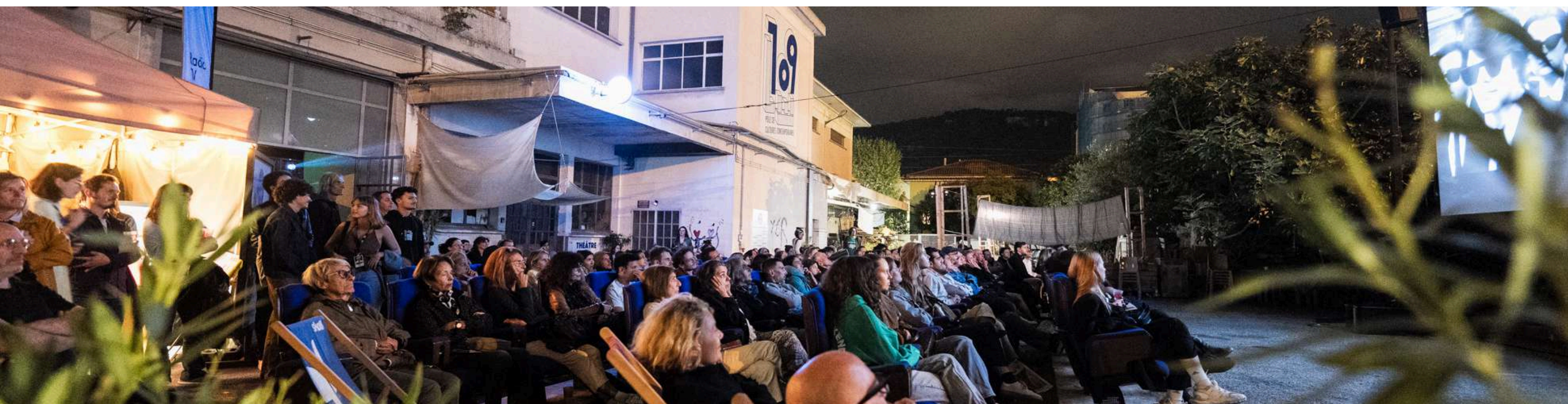
Parvis Chapel - Le 109, ouverture 2025